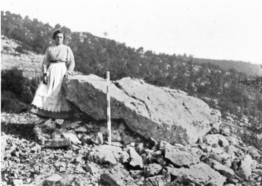
FIG. 1. — Aranzadi: Sur (después de caído el roble)