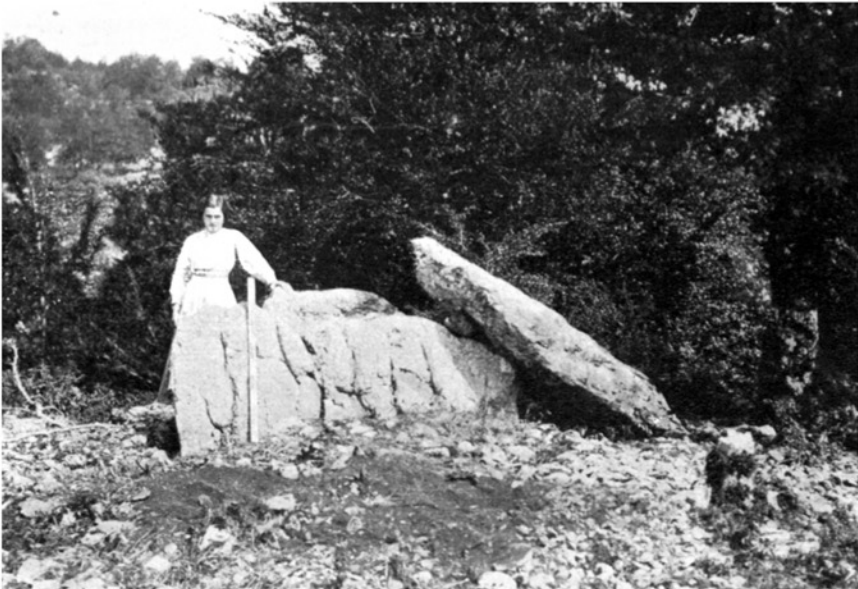
FIG. 2. — Pamplonagañe : Sur (después de explorarlo)