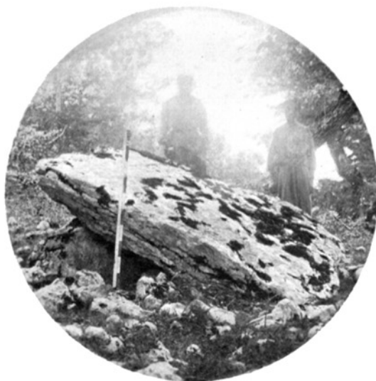
FIG. 1. — Otsopasaje : Sur