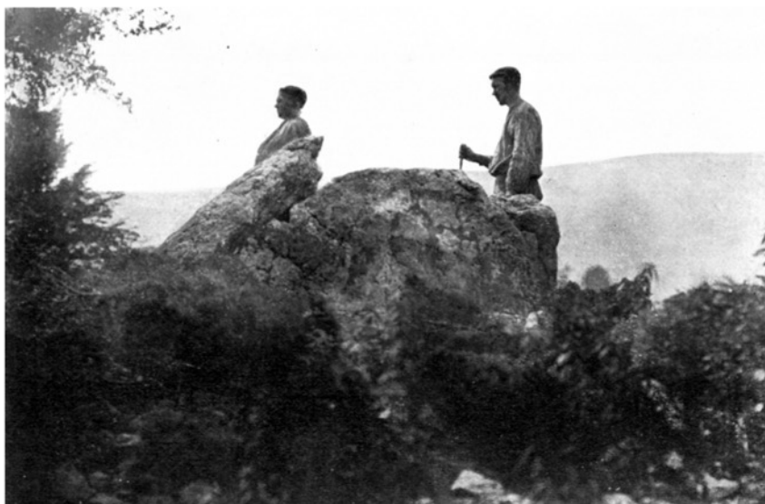
FIG. 2. — Pamplonagañe : Norte