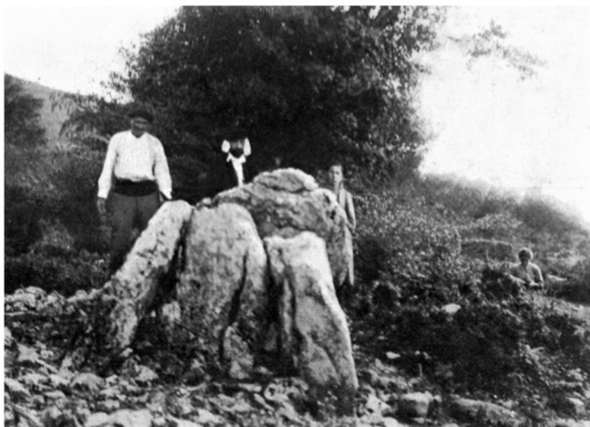
FIG. 1. — Pamplonagañe : Poniente