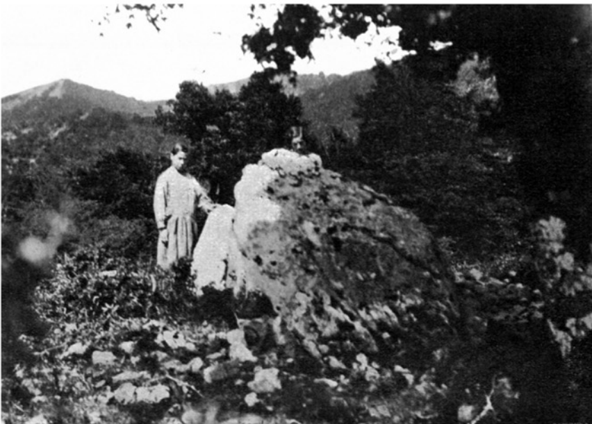
FIG. 2. — Pamplonagañe: Oriente