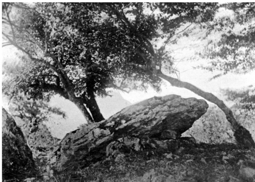
FIG. 2. — Otsopasaje : Norte